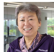
シンガポール国立大学 バージニア・チャ 教授